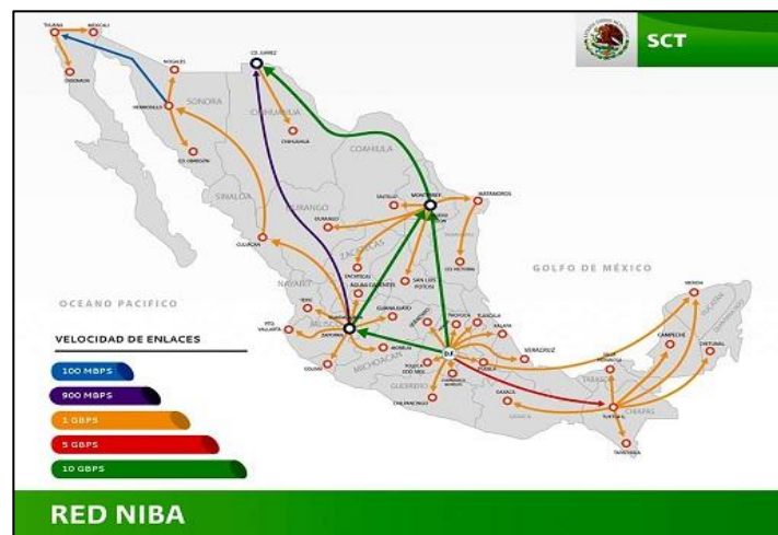
Figura 3. Red Nacional de Impulso a la Banda Ancha (Red NIBA)