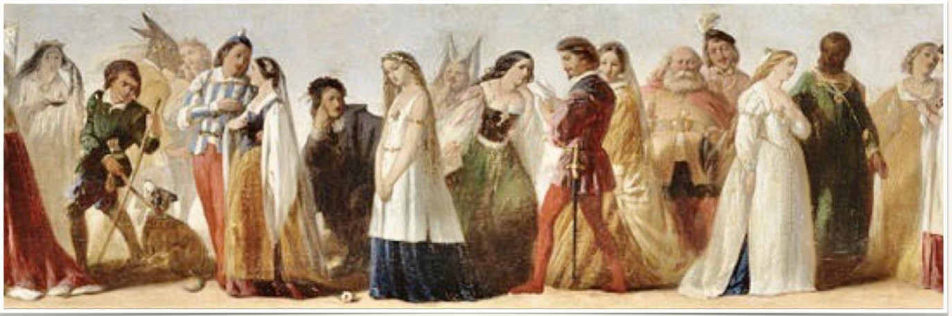
Conversatorio CUDI 15.12.20.