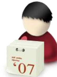
Administrador de Subscripciones