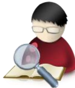
Editor de sección