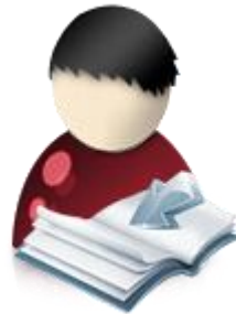
Gestor/a de revistas